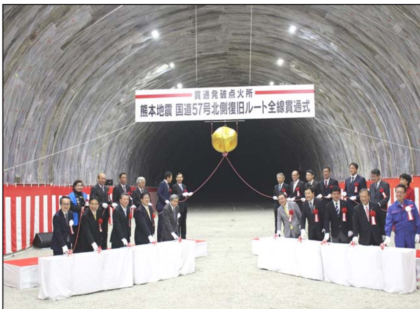
【貫通発破とくす玉開披】