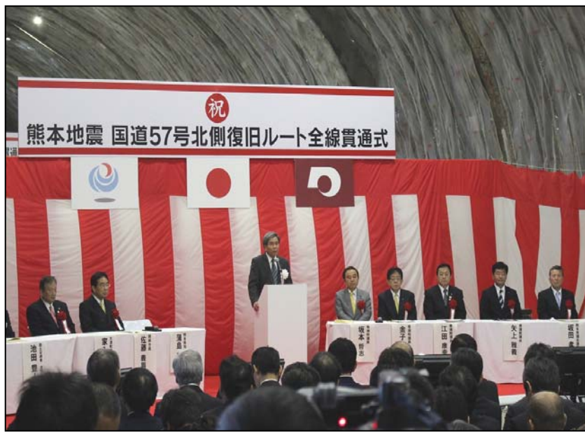
【蒲島知事による挨拶】