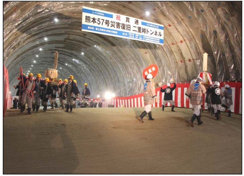
【樽神輿行進の様子】