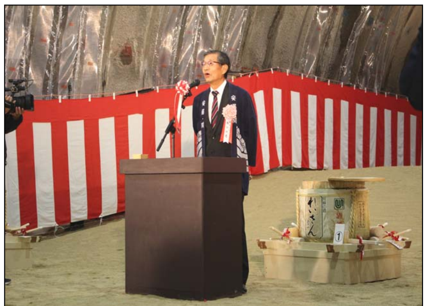
【坂口車帰区長による乾杯の挨拶】