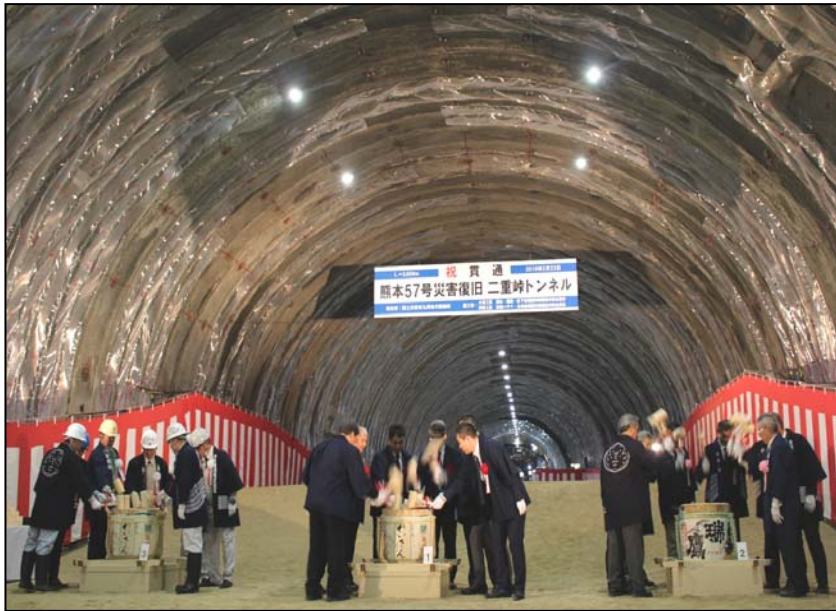
【代表者による鏡開き】