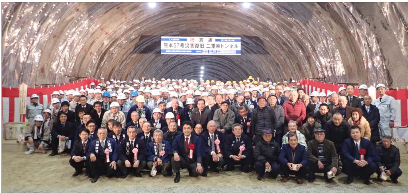
【参加者全員の集合写真】

平成29年6月の着工式より約1年8ヶ月で二重峠トンネルは貫通を迎えることができました。これもひとえに地元住民の皆様のご理解とご協力の賜物です。これからも引き続き、ご不便、ご迷惑をおかけいたしますが、何卒よろしくお願いいたします。