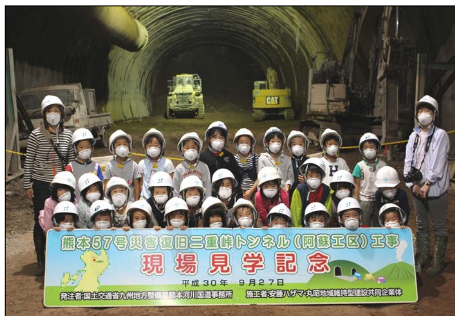
1年生の集合写真です