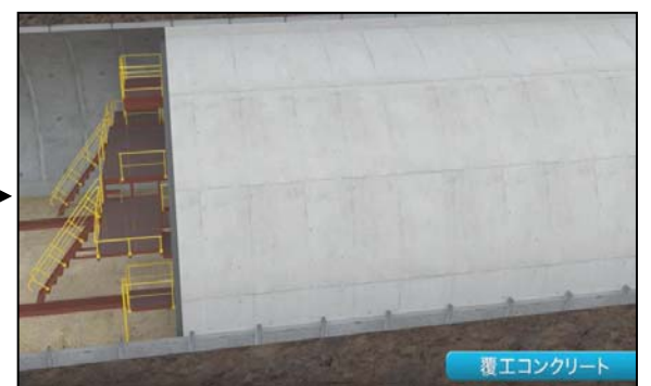
覆工コンクリート

①地下水がトンネル内にしみ出てこないよう ②セントルを用いて、防水シートとセントル シート台車によりトンネル表面を の間にコンクリートを流し込みます。 ③覆工コンクリート打設の完了です。 防水シートで覆います。