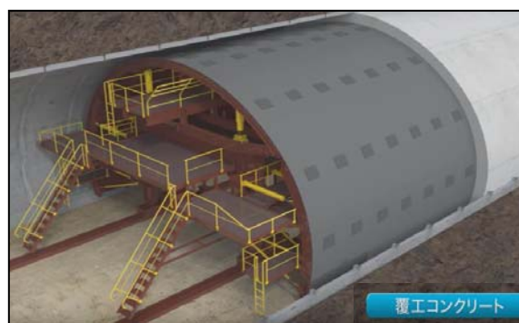
覆工コンクリート