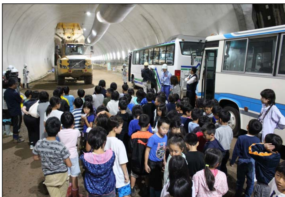
25tダンプの迫りに皆さん驚かれていました

○9月27日(木)、阿蘇西小学校の全生徒約130名を招いた見学会を開催しました。